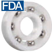
xirodur B180 保持器, 不銹鋼滾珠