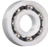
PA 保持器, 不銹鋼滾珠