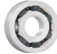
PA 保持器, 玻璃滾珠