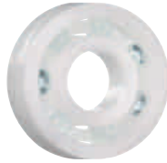
xirodur B180 保持器, 玻璃滾珠