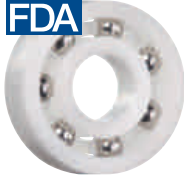
PE 保持器,, 不銹鋼滾珠